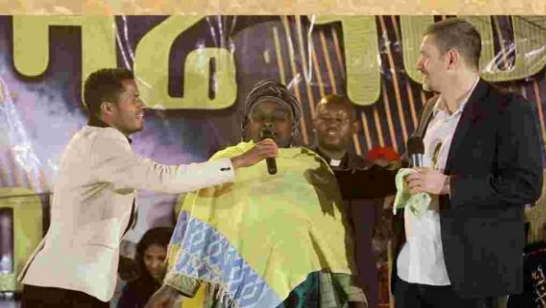
Zwei Jahre Diabetes und Nierenprobleme geheilt!