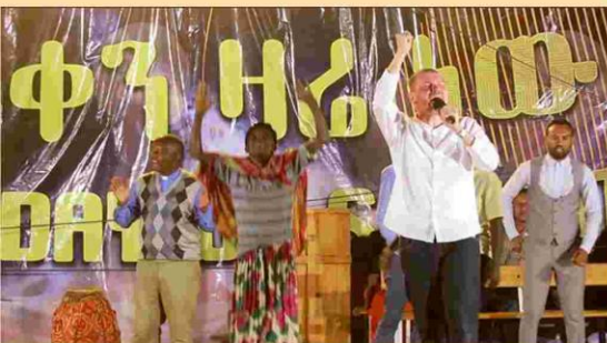
Gelähmt von Geburt an – geheilt!