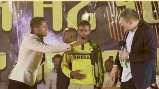
Geheilt nach elf Jahren Bauchschmerzen.