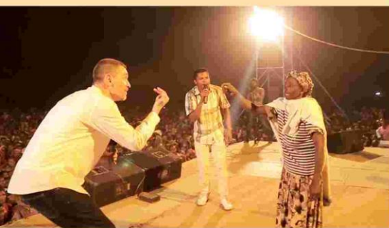
Zwölf Jahre Augenprobleme geheilt!