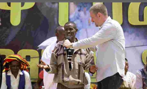
Mann kann nach zwölf Jahren wieder gehen.