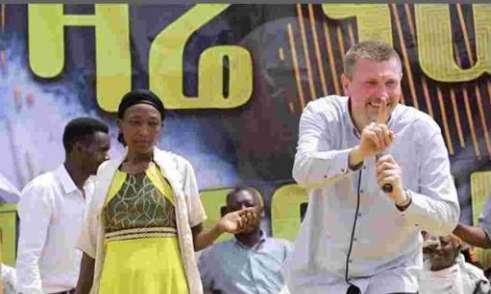
Geheilt von Herzproblemen.