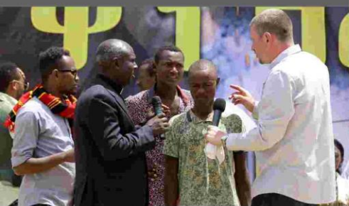
Taubstumm seit der Geburt - geheilt!