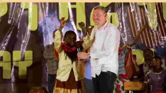
Kropf nach ca. zwölf Jahren verschwunden.